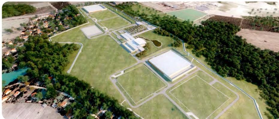
Mogi Mirim – o maior Data Center em construção no Brasil